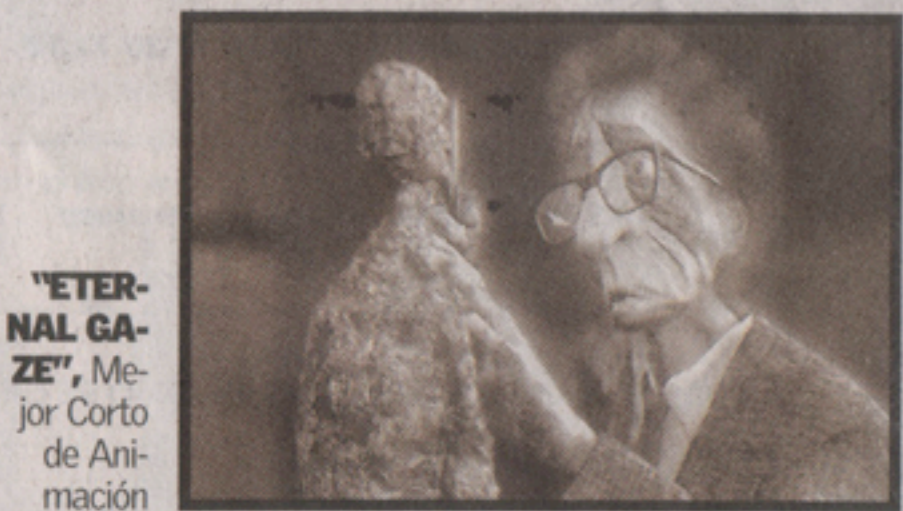
"ETERNAL GAZE", Mejor Corto de Animación