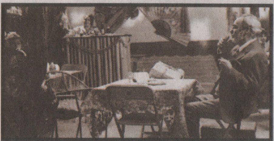
"LA NAO DE CHINA", Mejor Corto Mexicano