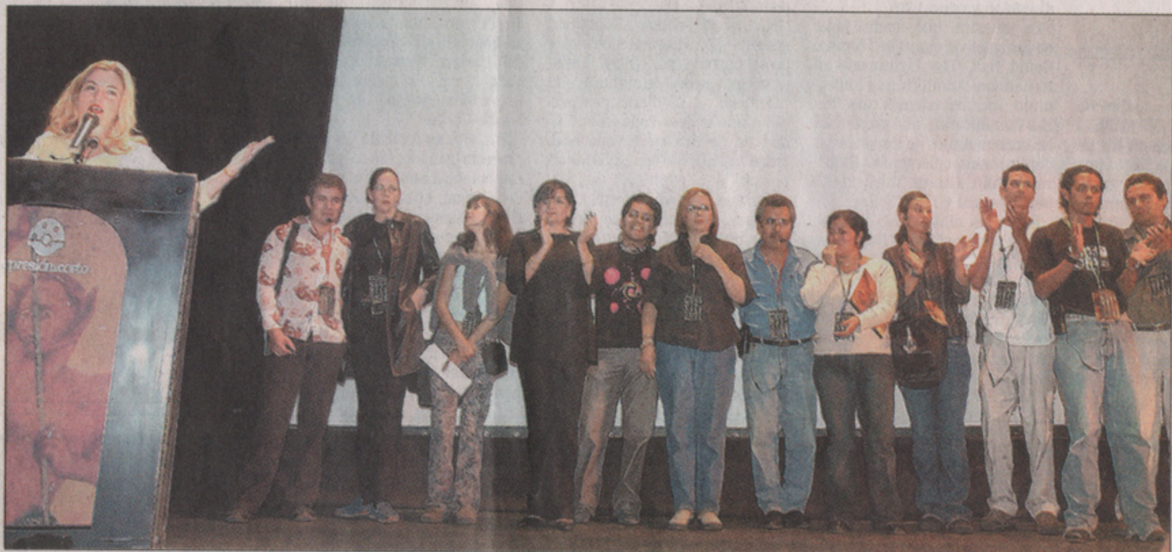
LA CEREMONIA de clausura en el Auditorio del Estado

• EDITOR: FERNANDO ROSALES OVALLE • EMAIL: gente@am.com.mx • EDITOR GRÁFICO: ADRIÁN PALMA • COEDITOR GRÁFICO: JOSÉ DE JESÚS SOLÍS PÉREZ • TEL: 291-99-00 • 291-99-03